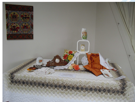
Akureyri – öll lífsins gæði