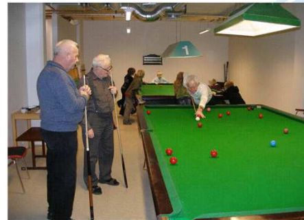
Akureyri – öll lífsins gæði