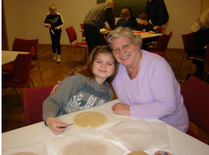
Akureyri – öll lífsins gæði