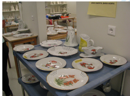
Akureyri – öll lífsins gæði