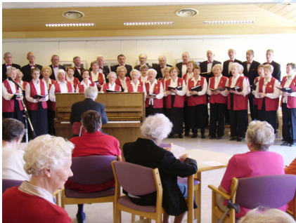
Akureyri – öll lífsins gæði