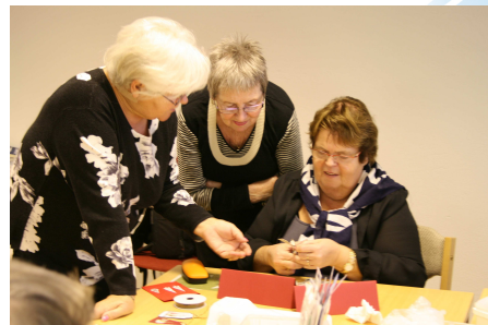
Akureyri – öll lífsins gæði