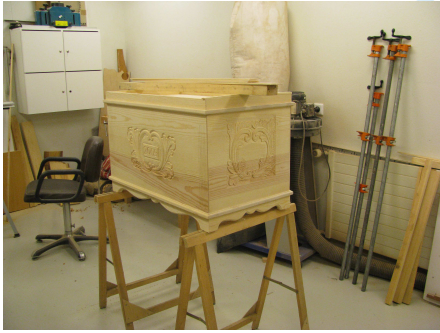
Akureyri – öll lífsins gæði