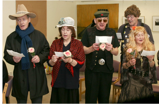
Akureyri – öll lífsins gæði