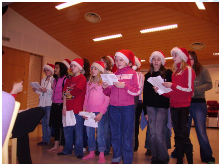
Akureyri – öll lífsins gæði