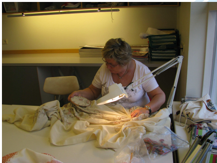
Akureyri – öll lífsins gæði