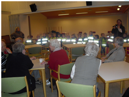
Akureyri – öll lífsins gæði