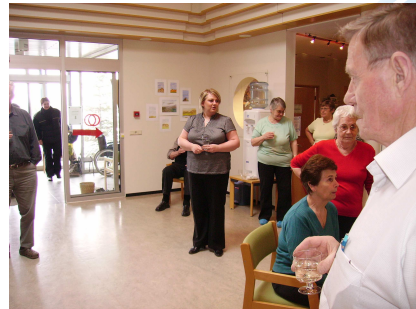
Akureyri – öll lífsins gæði