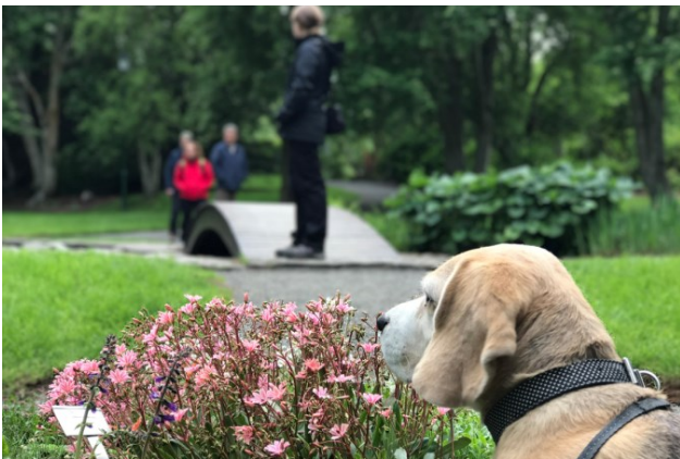
Myndir: Ragnar Hólm