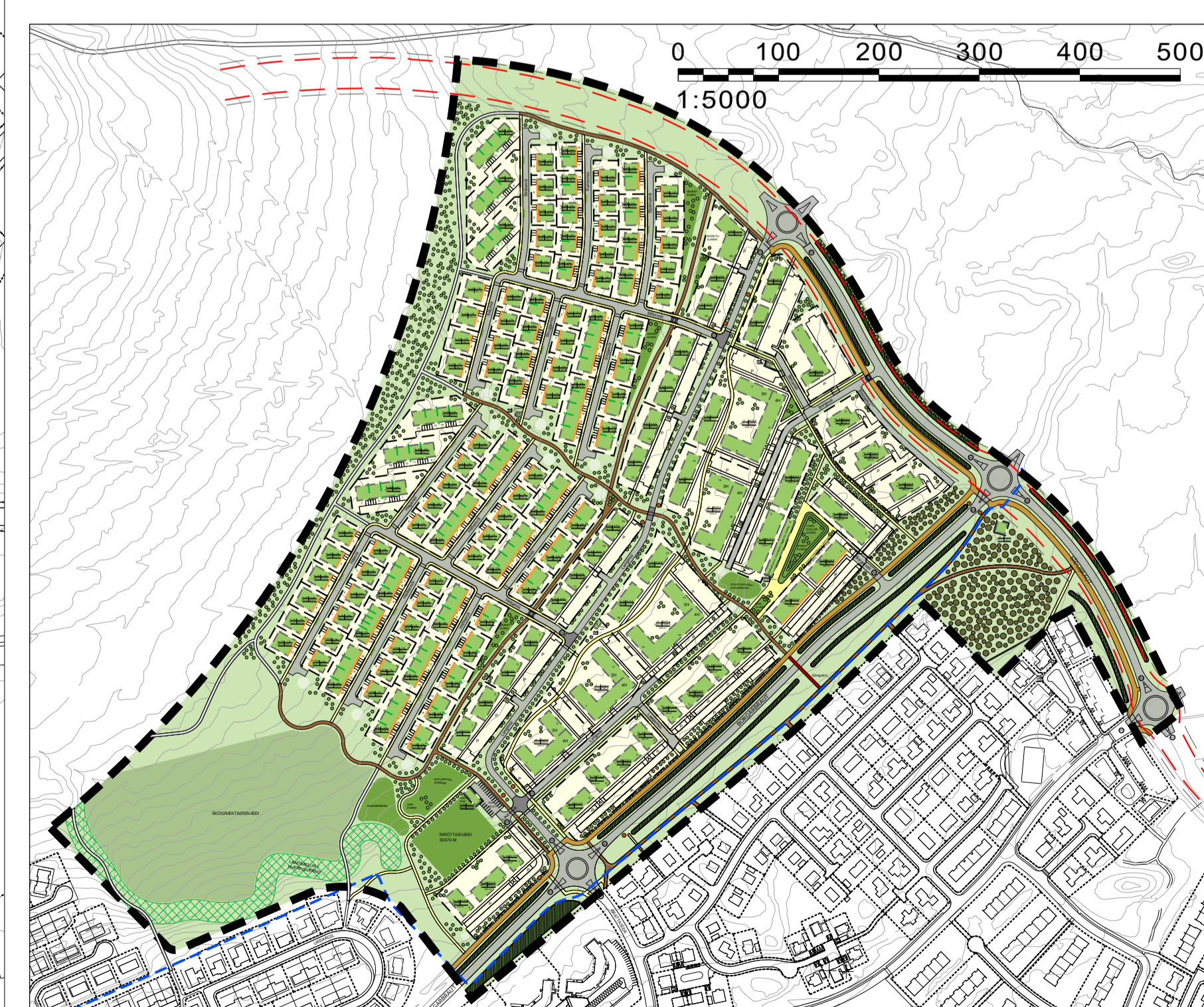
GILDANDI DEILISKIPULAG, MKV. 1:5000

Tillaga að breytingu á deiliskipulagi er á þessu breytingarblaði í mælikvarðanum 1:2000 eins og gildandi deiliskipulag. Gildandi deiliskipulag er á þessu breytingarblaði í mælikvarðanum 1:5000 vegna plásleysis.