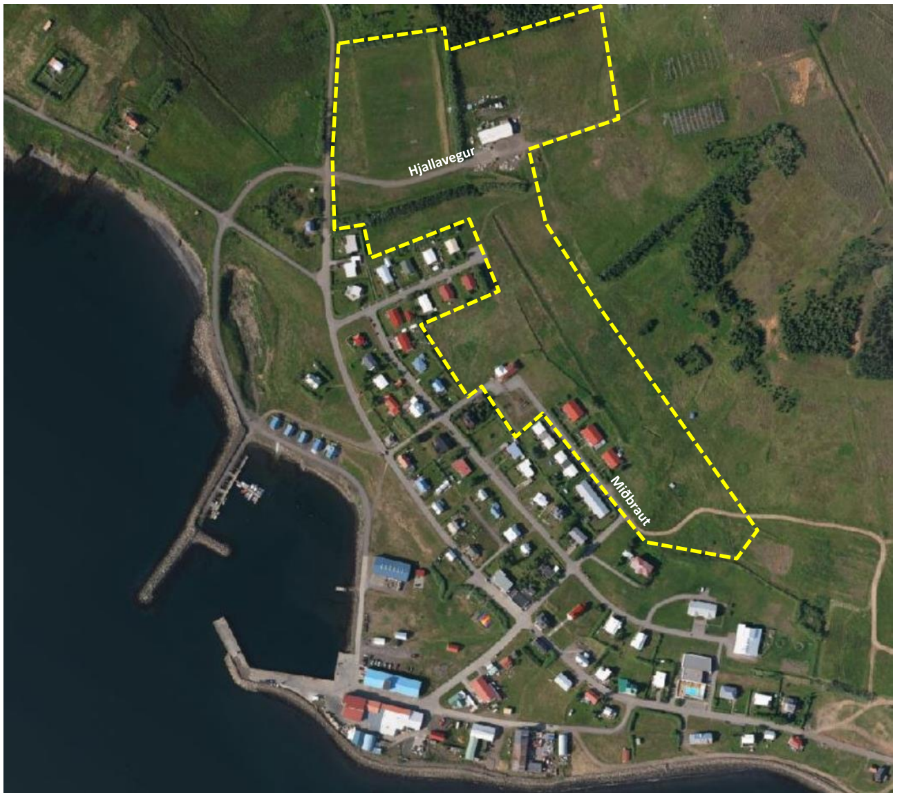
Mynd 1. Afmörkun skipulagssvæðisins.