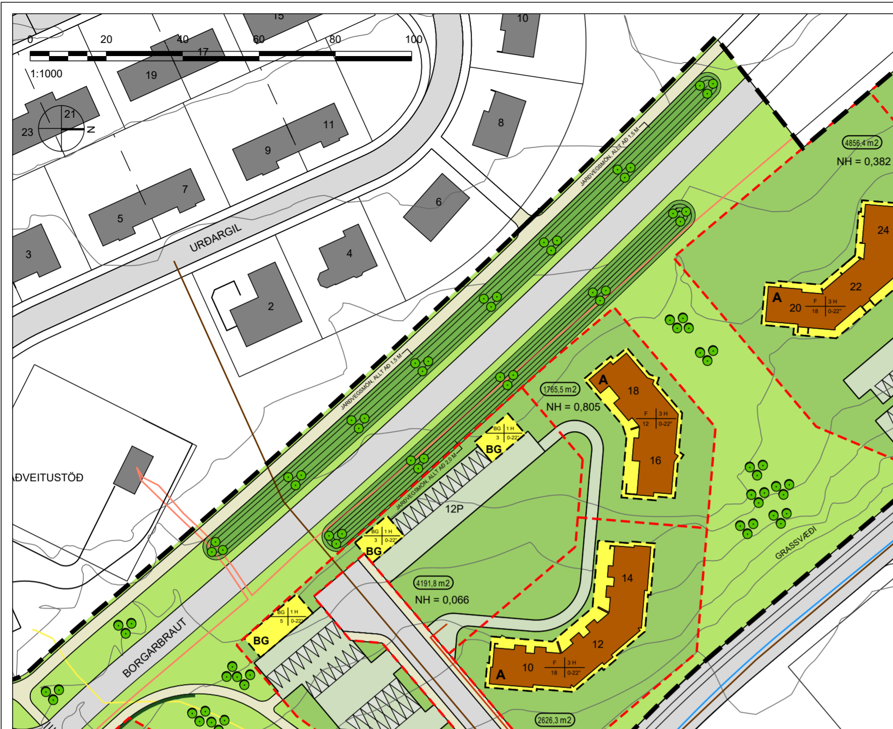
GILDANDI DEILISKIPULAG, ÖDLADIST GILDI 30.10.2012, M.S.BR.