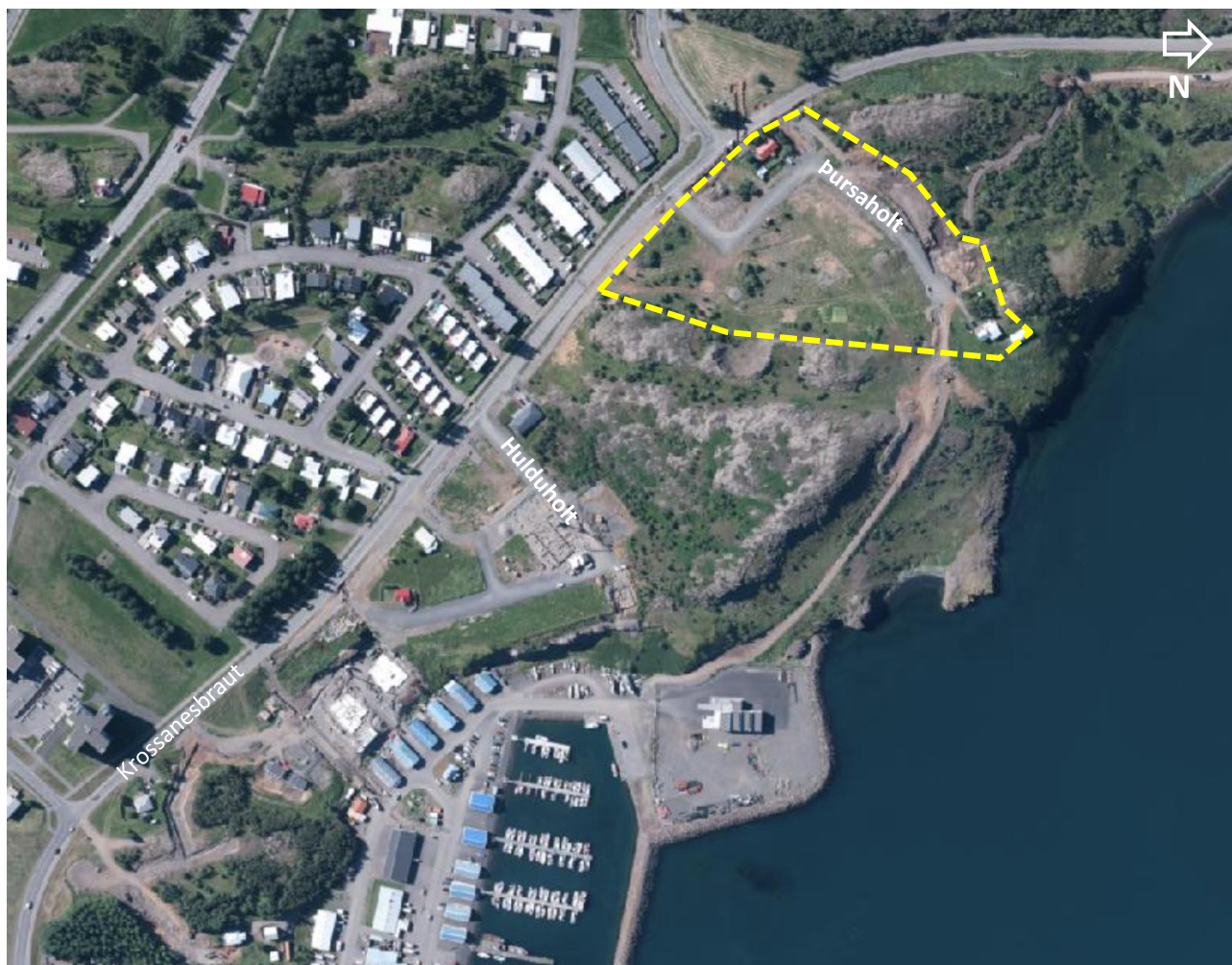
Mynd 1. Loftmynd sem sýnir staðhætti, gul brotin lína sýnir það svæði sem breytingin nær til.

Skv. skipulagslögum nr. 123/2010 skal við upphaf vinnu við gerð skipulagsáætlunar, aðalskipulagsbreytingar í þessu tilfalli, taka saman lýsingu á skipulagsverkefninu þar sem m.a. er skýrt hvernig staðið verði að skipulagsgerðinni.