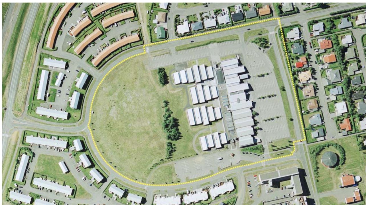
Mynd 1. Afmörkun skipulagssvæðisins.

Innan skipulagssvæðisins er m.a. lóð Verkmenntaskólans á Akureyri og byggingar skólans.