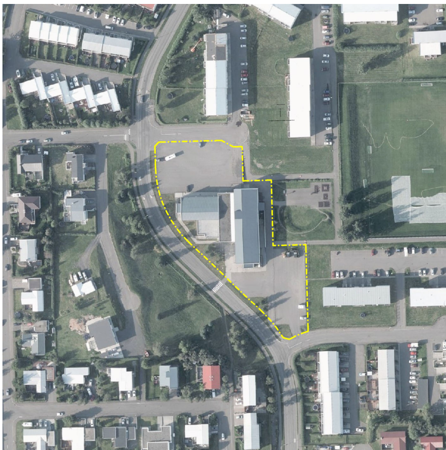
Mynd 1. Verslunarmiðstöðin Sunnuhlíð og nágrenni.

Skipulagssvæðið afmarkast af lóðarmörkum Sunnuhlíðar 12 en er einnig sér reitur í Aðalskipulagi Akureyrar.