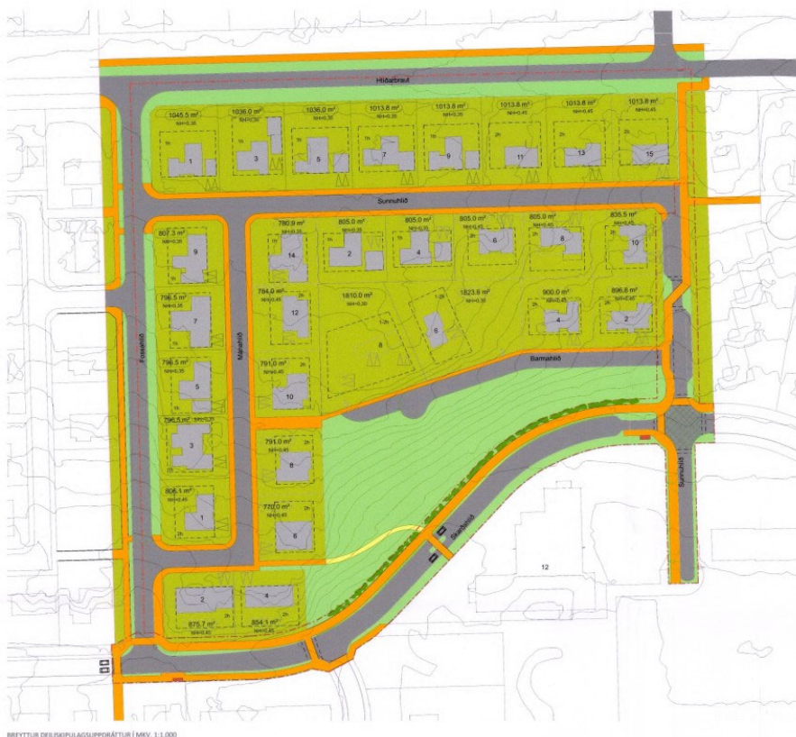
Mynd 4. Nýleg breyting á deiliskipulagi Fosshlíð, Mánahlíð, Sunnuhlíð og Barmahlíð.