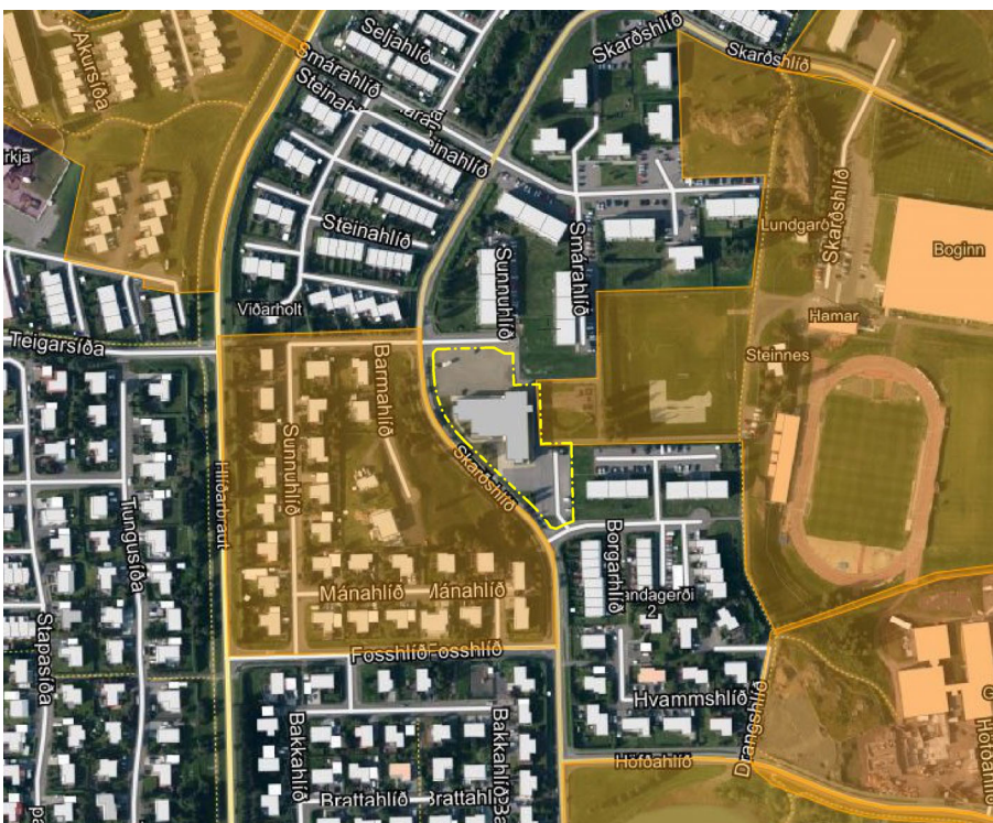
Mynd 3. Deiliskipulög í kringum svæðið.

Tvö deiliskipulög liggja að svæðinu. Íþróttasvæði Þórs á Akureyri er austan við og Fosshlíð, Mánahlíð, Sunnhlíð og Barmahlíð skipulagið er vestan megin, sem nýlega er búið að breyta.