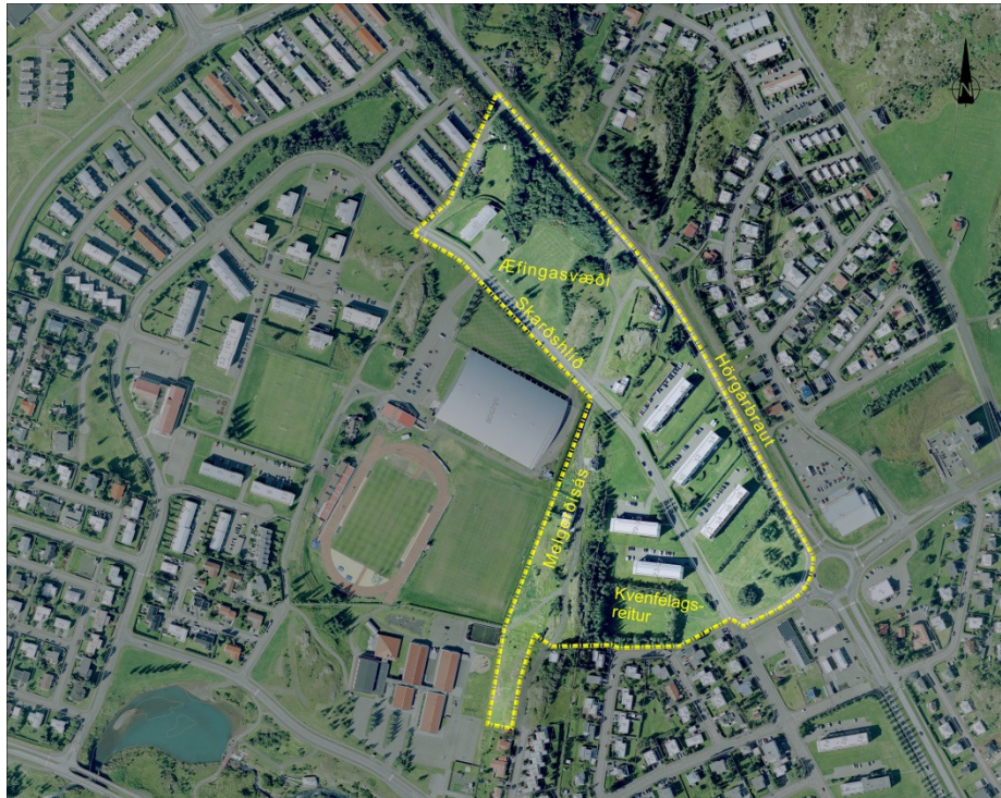
Mynd 2. Skipulagssvæðið

Skipulagssvæðið er 11,4 ha að stærð. Það liggur á milli Hörgárbrautar og Skarðshlíðar frá Undirhlíð að sunnan og að lóðamörkum við Litluhlíð. Einnig teygir svæðið sig eftir Melgerðisás til suðurs að lóðamörkum Áshlíðar og Háhlíðar. Að vestan liggur það að lóð Glerárskóla og íþróttasvæðis Þórs. Aðkoma að öllum lóðum á skipulagssvæðinu er frá Skarðshlíð fyrir utan Melgerði og Hjarðarholt. Þau hafa aðkomu frá vegslóða sem áður var þjóðvegurinn inn til bæjarins og liggur ofan á Melgerðisásnum.