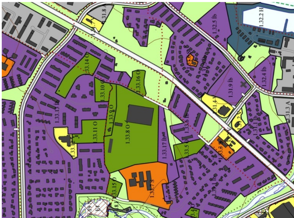
Mynd 1. Aðalskipulag Akureyrar 2005-2018