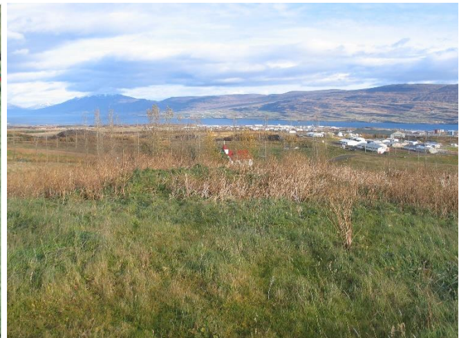
Mynd 2, horft til norðausturs yfir veggjabrot og dældir eftir útihús (Lögmannshlíð-1764-2) efst á háum hól suðvestast í gamla túninu í Lögmannshlíð. Lögmannshlíðarkirkja í bakgrunni fyrir miðri mynd.