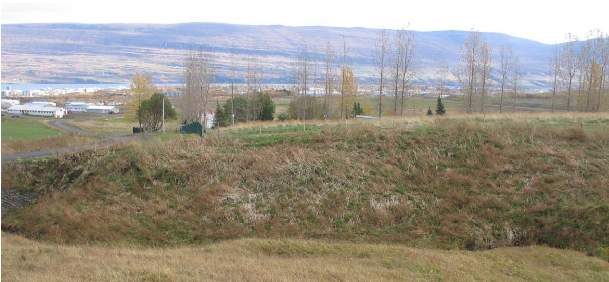
Mynd 1, horft til austurs yfir bæjarstæði Lögmannshlíðar (Lögmannshlíð-1764-1), innan um trén sést glitta í Lögmannshlíðarkirkju. Nær fyrir miðri mynd sér í fornlegar tóftir (Lögmannshlíð-1764-5).