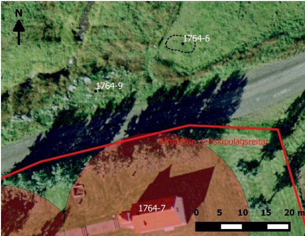
Teikning 3, Rauði hringurinn umhverfis kirkjuna neðst á teikningunni markar mögulega staðsetningu eldri kirkju og /eða kirkna (Lögmanshlíð-1764-7). Lögmanshlíð-1764-9 eru óljósar hleðsluleifar sem búið er að raska og Lögmanshlíð-1764-6 dældir í túni, hugsanlega leifar útihúsa sem sýnd eru á túnakorti frá 1918.