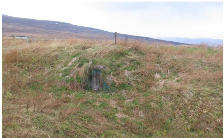
Mynd 6, niðurgrafin kartöflugeymsla norðanvert í gili bæjarlækjarins í Lögmanshlíð. Ekki er um eiginlegar fornleifar að ræða en þar sem mannvirkið er að hluta úr torfi var það skráð með.

Kartöflugeymslan er grafin talsvert niður í brekkubrúnina að norðanverðu, en hlaðið með streng sín hvorum megin við dyrnar sem vísa til suðurs og torf yfir þaki og uppúr því lítill strompur. Byggingin er um 5m í þvermál að utanverðu en óvíst með innanmál. Sneiðingur liggur frá dyrunum til vesturs upp á bakkann.