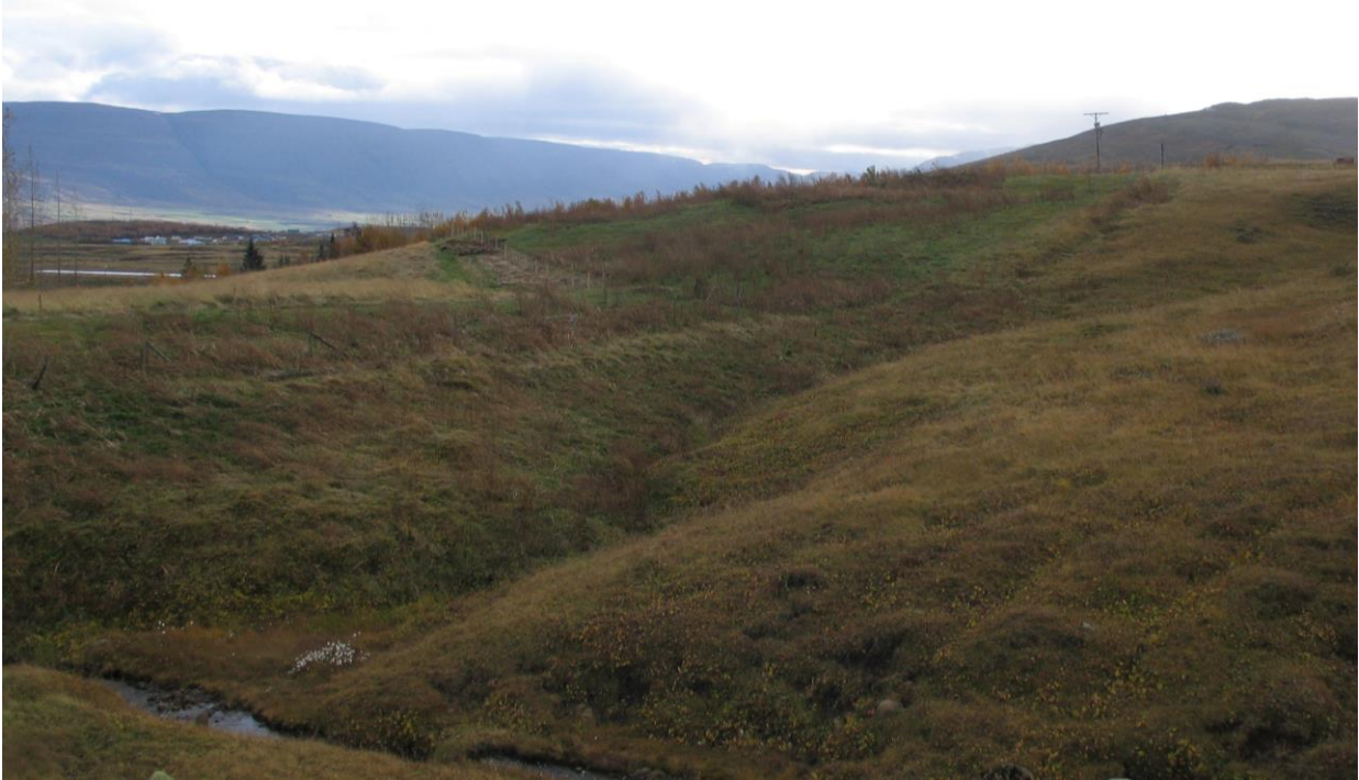
Mynd 5, horft til suðvesturs yfir túngarð (Lögmanshlíð 1764-8) þar sem hann liggur til suðurs upp á hólinn vestan við útihúsatóftina (Lögmanshlíð 1764-2). Garðurinn sést glögg og hægra megin við græn gróðurskil.

Um sögu Lögmanshlíðarkirkju, lýsingu á kirkjubyggingunni og kirkjugripum hennar má lesa í 10. bindi bókaflokksins Kirkjur Íslands.