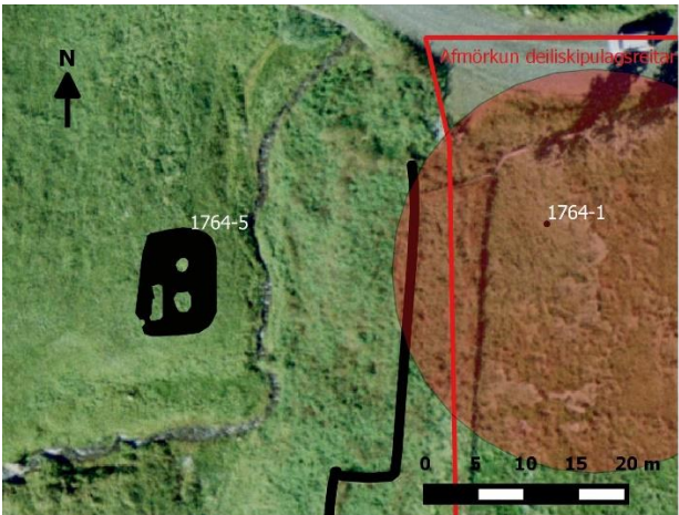
Teikning 2, tóft Lögmanshlíð-1764-5. Svört lína er túngarður (Lögmanshlíð-1764-8). Rauð lína markar útmörk skipulagsreitar og rauða skyggða svæðið áætlað bæjarstæði Lögmanshlíðar (Lögmanshlíð-1764-1).