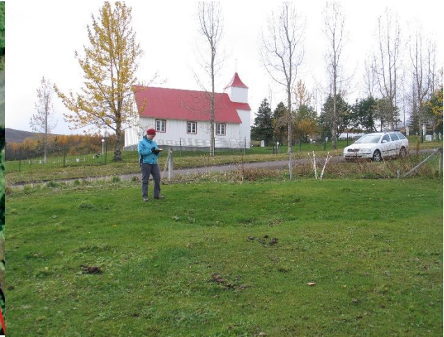
Mynd 4, horft SSA yfir dældir (Lögmanshlíð-1764-6) í túninu norðan Lögmanshlíðarveggar. Miðað við túnakort frá 1918 var útihús á þessum slóðum.