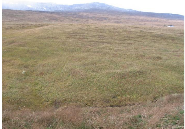
Mynd 3, horft til vesturs yfir fornlega tóft (Lögmanshlíð-1764-5), vestan við bæjarstæðið í Lögmanshlíð.