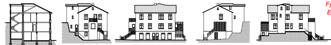
ÞVERSNIÐ OG ÚTLIT, HAFNARSTRÆTI 71 FYRIR BREYTINGU

Það stendur að nýtingarhlutfallið (töflu 2 í kafla 2.4.1 bls. 17) á reitnum sé 0,35 en rétt nýtingarhlutfall miðað við núverandi byggingu og fasteignarmat ríkisins er í kringum 0,88. Nýtingarhlutfallið eftir breytingu verður 0,95, sem er sambærilegt reitunum fyrir nýbyggingar við H69 og H75.