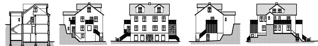
ÞVERSNIÐ OG ÚTLIT, HAFNARSTRÆTI 71 EFTIR BREYTINGU