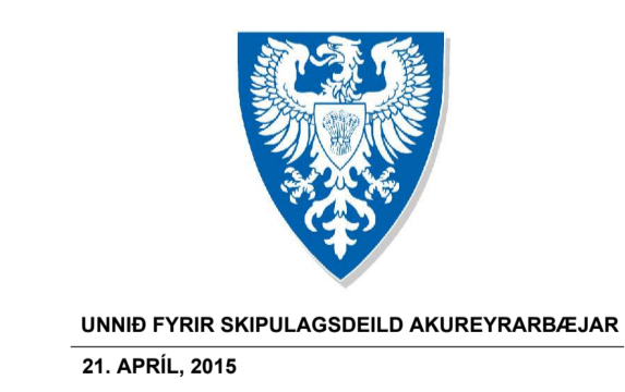
UNNIÐ FYRIR SKIPULAGSDEILD AKUREYRARBÆJAR 21. APRIL, 2015

Deiliskipulagsbreyting þessi sem fengið hefur málsmeðferð skv. 1. mgr. 43.gr. skipulagslaga nr. 123/2010 var auglýst frá _____ til _____ og var samþykkt í skipulagsnefnd Akureyrar þann _____. Samþykkt í bæjarstjórn Akureyrar þann _____ Bæjarstjóri Akureyrarkaupstaðar _____ Auglýsing um gildistöku breytingarinnar var birt í B-deild Stjórnartíðinda þann _____.