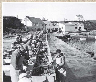
„Sildarsöltun á stéttinni í Sandvík“ um 1960 Lengi var allur fiskur verkaður í skreið en eftir 1883 var farið að verka saltfisk og frá 1955 til loka sildaráranna var söltuð sild í Grimsey. Stóra hvíta húsið er Frystihúsið sem var byggt um 1945.