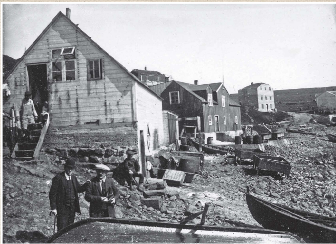
„Í Sandvíkinni“ 1928 Meðfram fjöruborðinu byggðu Húsavíkurkaupmenn fiskverkunar- og verslunarhúsið. Húsið til vinstri er Bjarnahúsið, Dökkka húsið er Fátshúsið, þar býrjaði KEA verslunarrekstur sinn árið 1929.