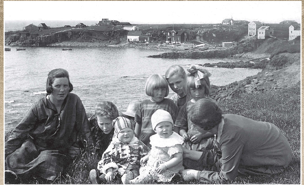
„Girls on Eiðabakkinn sand spur“ 1928 In the background, Sandvík cove and the Sandvík seacliffs, used in days gone by as a natural pier. Above the cove the village is growing.