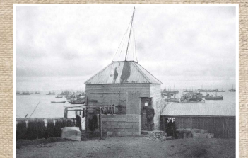
„Verzlun“ 1930's Verzlun Hölmfríðar S. Geirald var í turni á húsi sem hét Strandberg sem nú er horfið. Í baksýn sést sildarflotinn í innlegu.

and in 1990 the inner harbour was completed and taken into service. Now there are several fishing companies on Grimsey, marketing both salted and fresh fish.