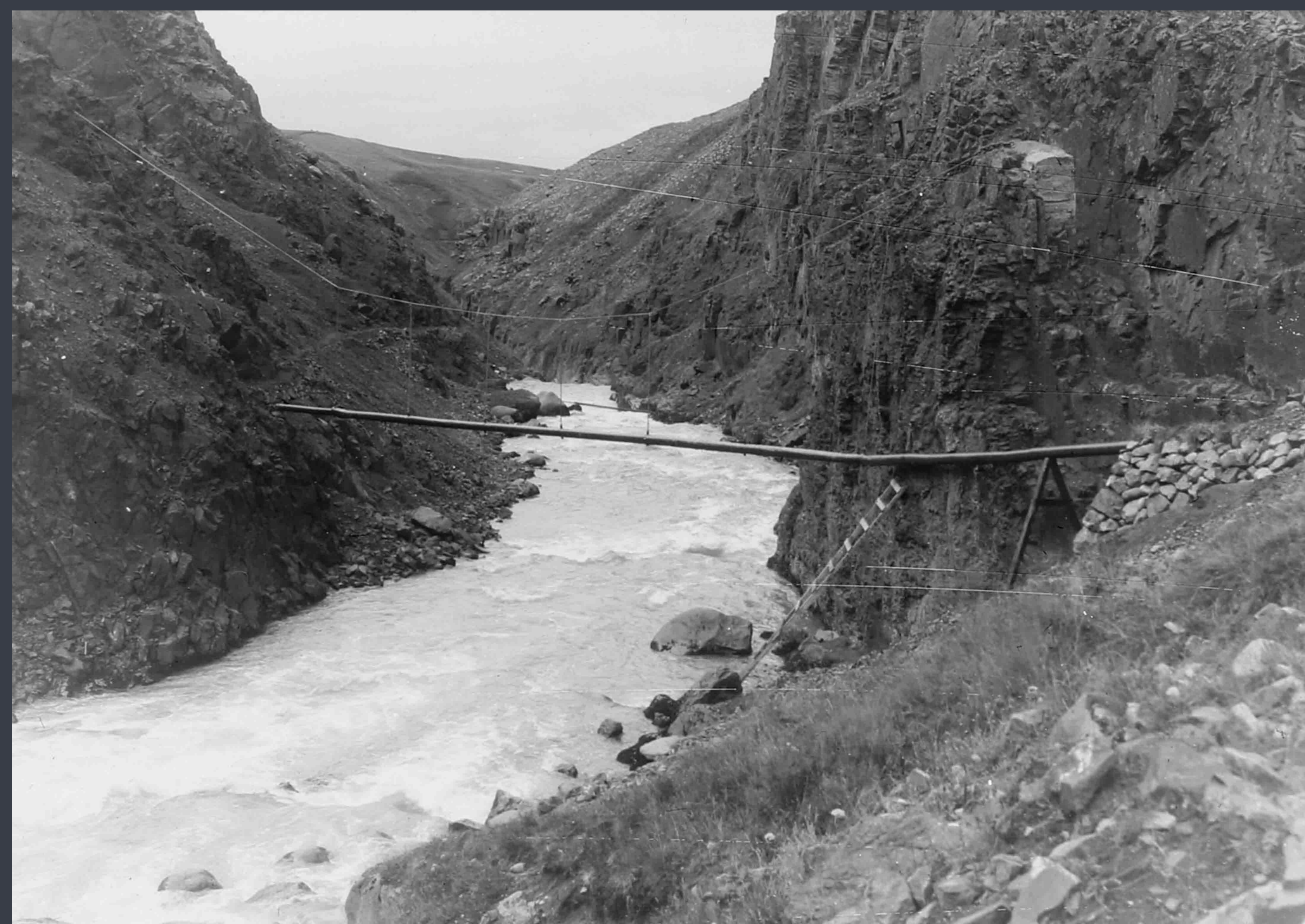
Heitavatnslögnin í Glerárgili lögð árið 1933. Enn má sjá leifar eftir lögnina í gilinu. The hot water pipes in Glerárgil gully were installed in 1933. The remains of the pipes are still visible