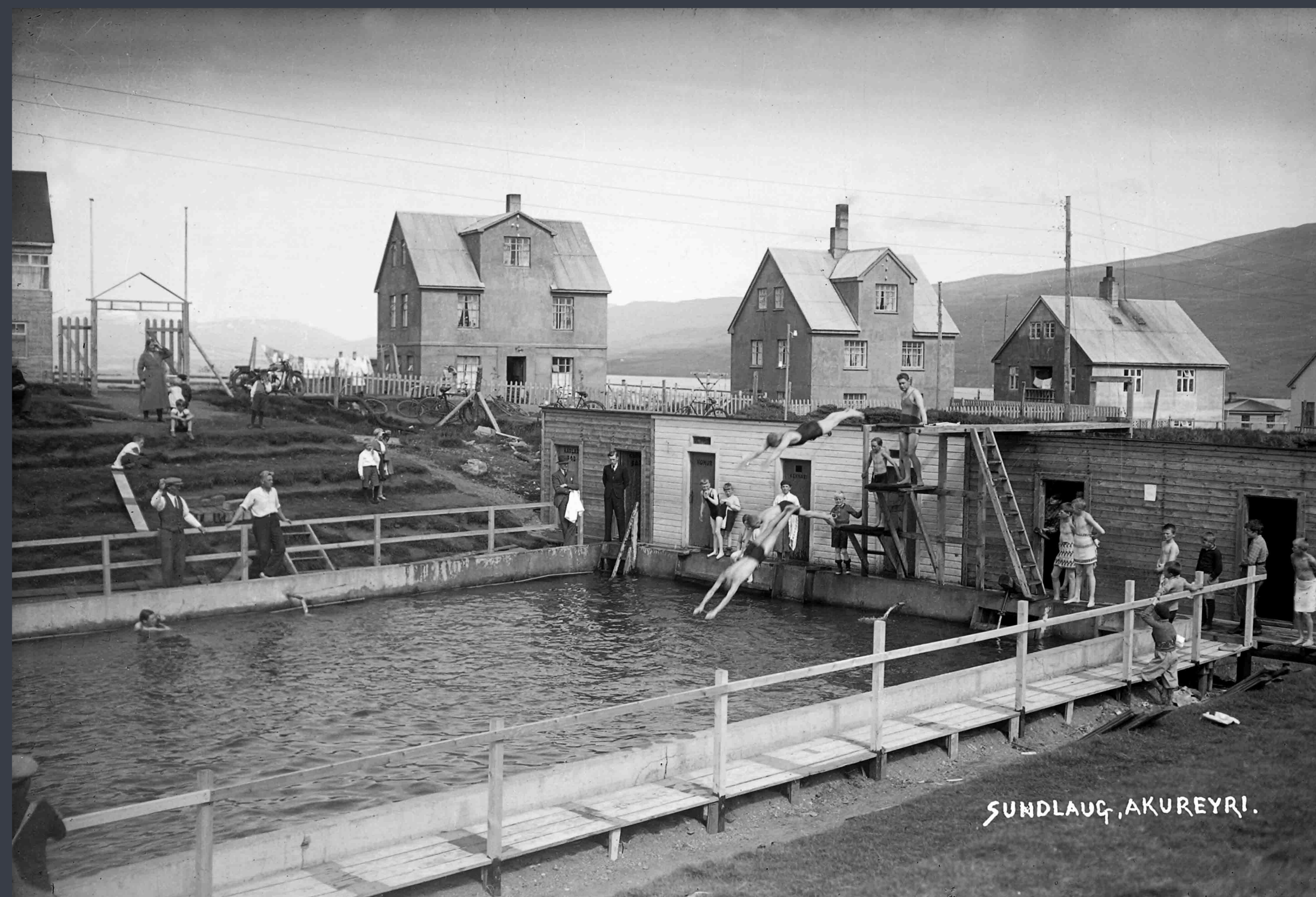
Akureyrarsundlaug í Grófargili árið xxxx. Sundlaugin er á svipuðum stað í dag. Akureyri Swimming Pool in Grófargil in XXXX. The current pool is in a similar location.