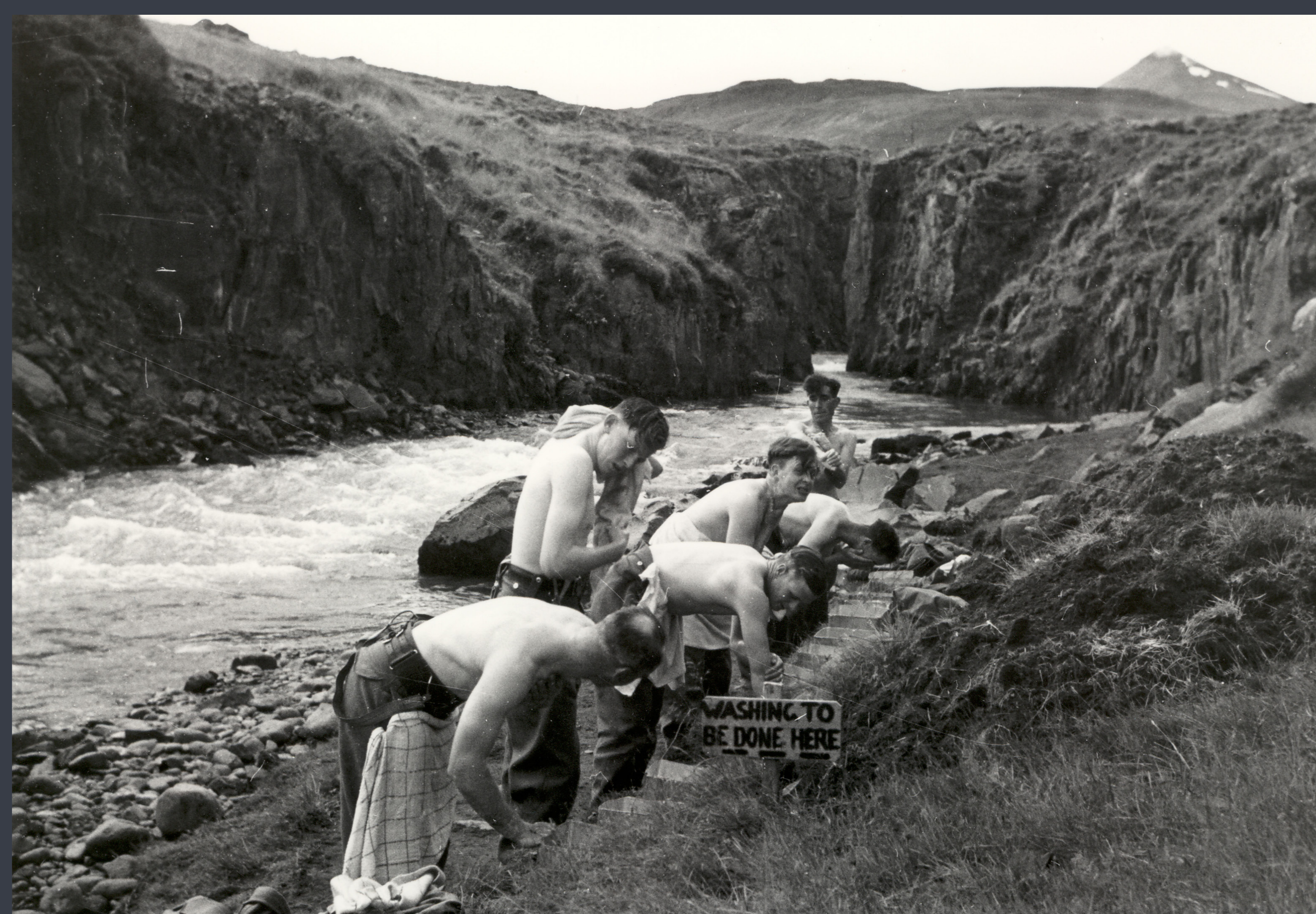
Breskir hermenn að þvo sér úr volgu vatni við Glerá um 1940. British soldiers enjoy the warm waters of Glerá river around the year 1940.